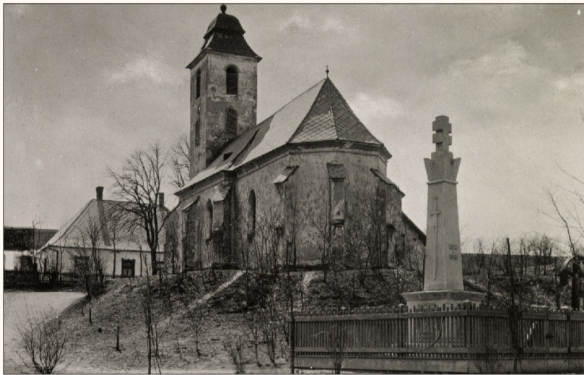
A Hősök szobra a katolikus templom mellett